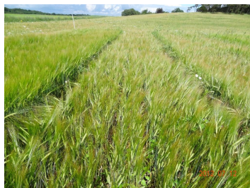
Foto 1. Simba i parcel med placeret gødning, sorten har lav konkurrenceevne over for ukrudt. (Klik på billedet for stor udgave).