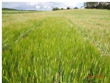
Foto 2. Quench i parcel med placeret gødning, den er både højere og tættere i væksten end Simba. (Klik på billedet for stor udgave).

Artiklen har været bragt i et medie under LandbrugsMedierne